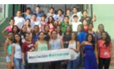
▲ U. N. de San Martín