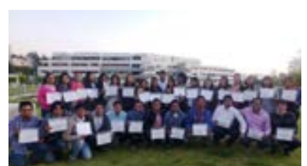
▲ U. Católica San Pablo