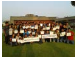
▲ TECSUP Lima