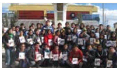
▲ U. N. Daniel Alcides Carrión