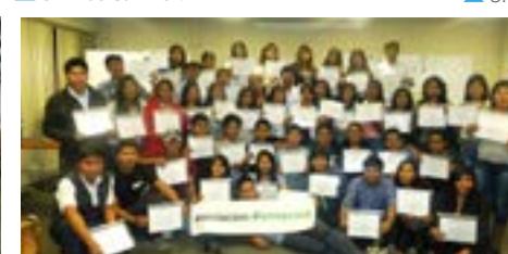
▲ U. N. de San Agustín