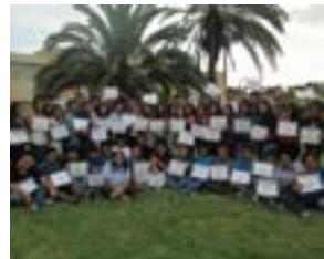
▲ TECSUP Trujillo