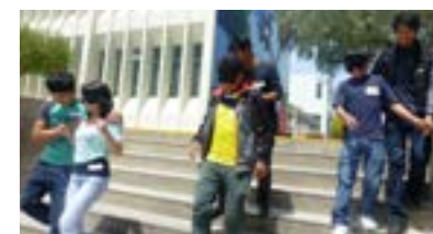
Universidad Nacional Toribio Rodríguez de Mendoza (Amazonas)

¡Felicitaciones! porque es una buena forma de proyectarse hacia la sociedad, que bien que apuesten por la educación. ¡Muchas gracias por la experiencia! VNSAAC, USCO