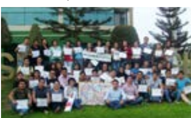
▲ U. Señor de Sipán