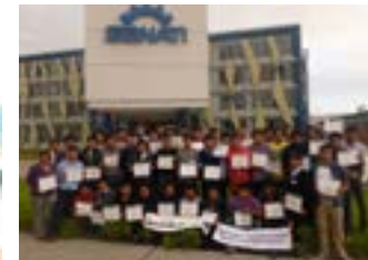
▲ SENATI Arequipa