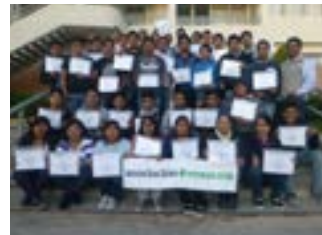
▲ TECSUP Arequipa