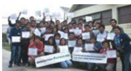
▲ U. N. de Ingeniería