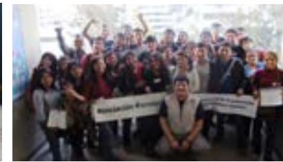
▲ U.N. del Callao