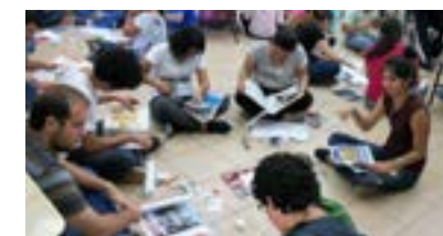
Instituto Peruano de Fomento Educativo (IPFE)