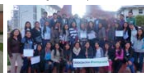
▲ U. N. San Antonio Abad de Cusco