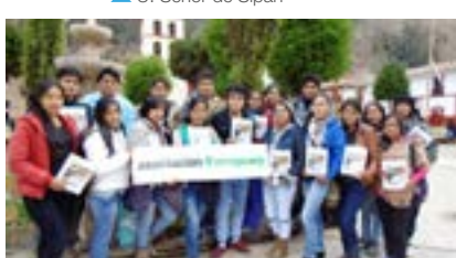
▲ U. N. de Huancavelica