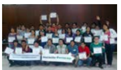
▲ U. N. San Luis Gonzaga