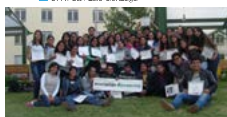
▲ U. P. del Norte