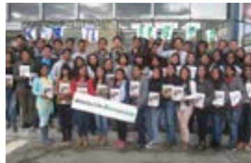
▲ U. Continental