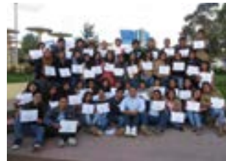
▲ U.N. del Centro del Perú