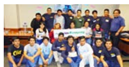
▲ THINK BIG Lima