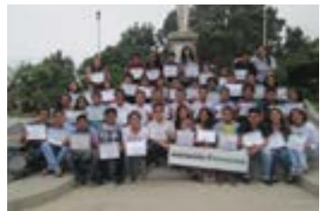
▲ U. N. de Trujillo