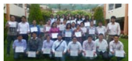
▲ U. Católica de Santa María