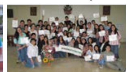
▲ U. N. Pedro Ruiz Gallo - Grupo II