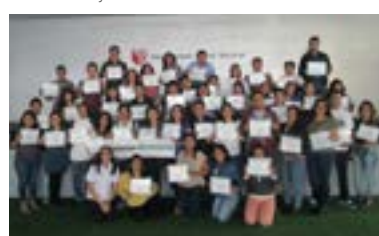
▲ U. César Vallejo