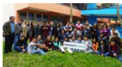
▲ U. N. Mayor de San Marcos