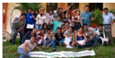
▲ U. N. de Tumbes