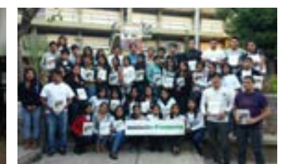
▲ U. N. San Cristóbal de Huamanga