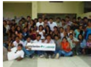
▲ U.N. Amazónica de Madre de Dios