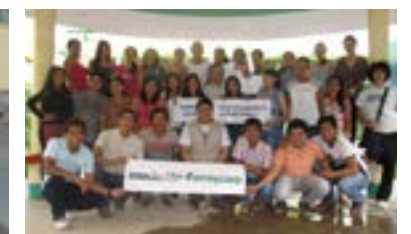
▲ U. N. de Ucayali