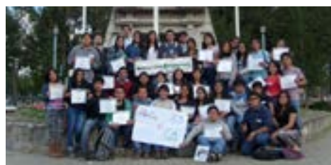
▲ U. N. de Cajamarca