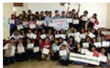
▲ U. N. Pedro Ruiz Gallo - Grupo I