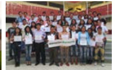
▲ U. N. del Santa