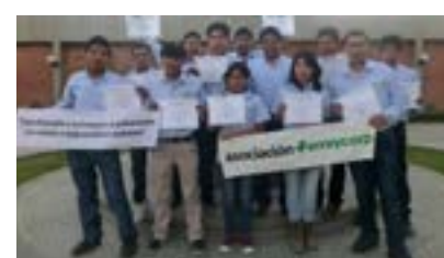
▲ THINK BIG Arequipa