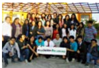
▲ U. José Carlos Mariátegui