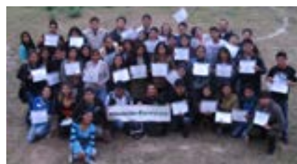
▲ U. N. Jorge Basadre Grohmann