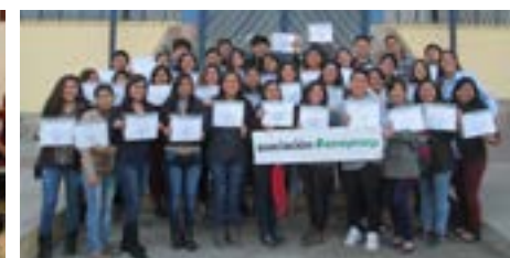
▲ U. P. de Tacna