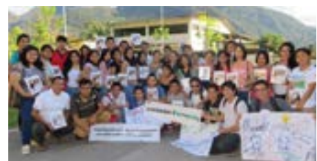
▲ U. N. Agraria de la Selva