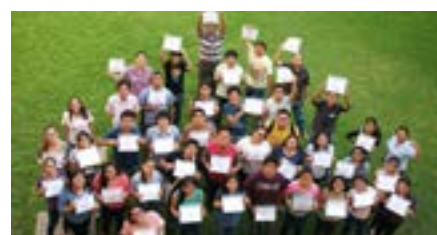
▲ U. de Piura