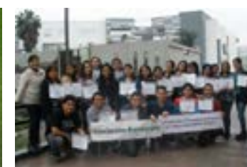
▲ U. San Martín de Porres