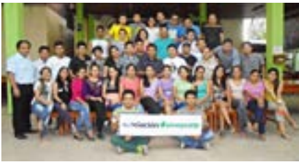
▲ U. N. de la Amazonia Peruana