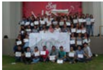
▲ U. Católica de Santo Toribio de Mogrovejo