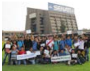
▲ SENATI Lima