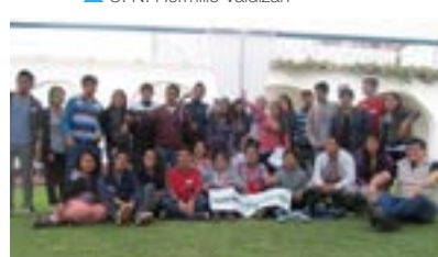
▲ IPFE Lima