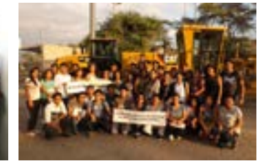
▲ U. N. de Piura