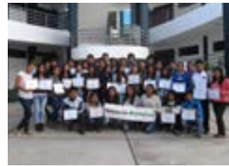
▲ U. N. José María Arguedas