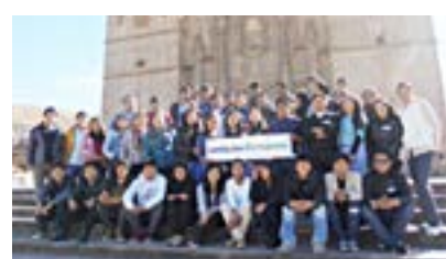
▲ U. N. del Altiplano