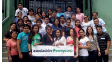
▲ U. N. de San Martín