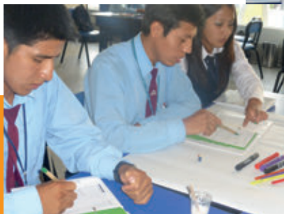
Senati, sede Arequipa