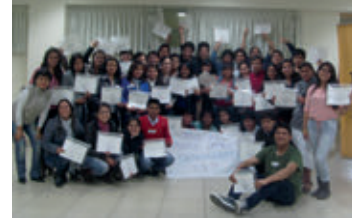
▲ U. P. del Norte