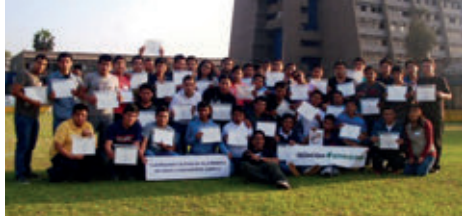
▲ SENATI, Lima