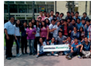
▲ U. N. de Ingeniería