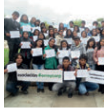
▲ U.N. del Centro del Perú