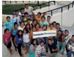
▲ U. N. de Tumbes