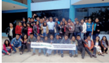
▲ U. N. del Callao