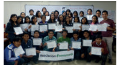
▲ U. N. de San Agustín