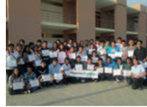
▲ TECSUP Trujillo