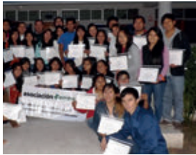
Antúnez de Mayolo