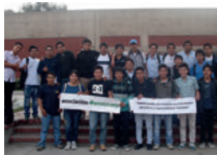
▲ THINK BIG Lima