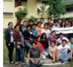
▲ U. N. Agraria de la Selva