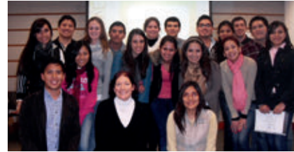
▲ Ferreycorp Setiembre