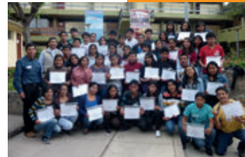
▲ U. N. San Cristóbal de Huamanga