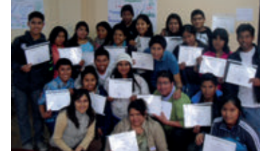
▲ U. N. de Moquegua, sede Ilo