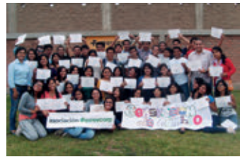
▲ U. N. Pedro Ruiz Gallo