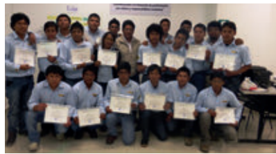
▲ THINK BIG Arequipa