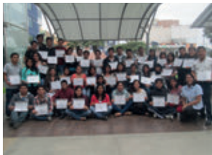
▲ U. César Vallejo