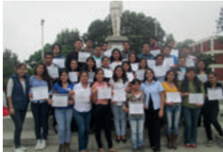
▲ U. N. de Trujillo