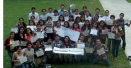
▲ U. Católica de Santo Toribio de Mogrovejo