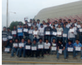
▲ TECSUP Arequipa