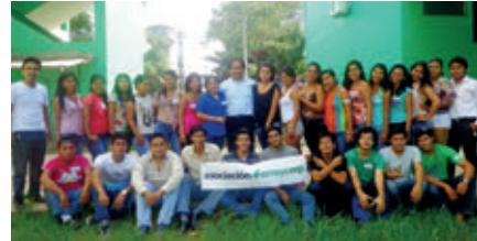
▲ U. N. de Ucayali