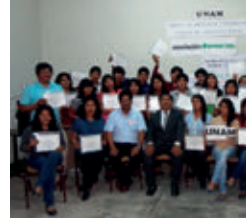
▲ U. N. de Moquegua, sede Moquegua