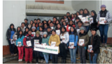
▲ U. N. Daniel A. Carrión