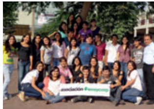
▲ U. San Martín de Porres