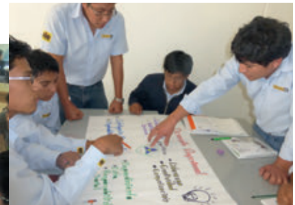
Programa Think Big, sede Arequipa