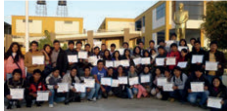
▲ U. N. Jorge Basadre Grohmann