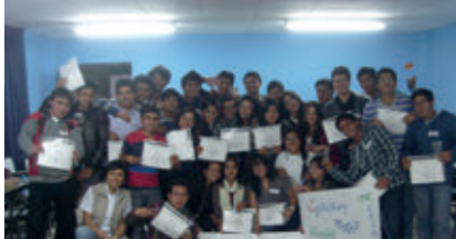
▲ U. N. de Cajamarca