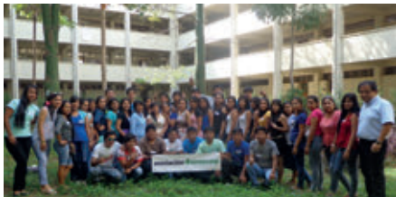
▲ U. N. Amazónica de Madre de Dios