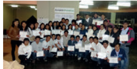
▲ U. N. del Altiplano