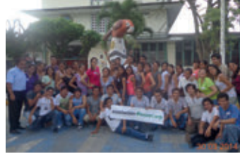
▲ U.N. de la Amazonía Peruana