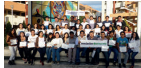
▲ U. Católica Santa María