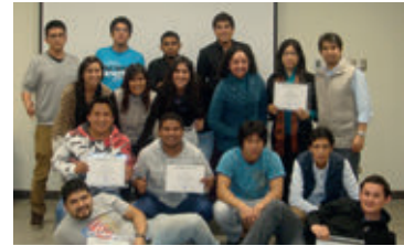
▲ Ferreycorp Agosto