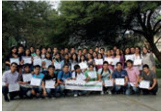
▲ U. N. del Santa