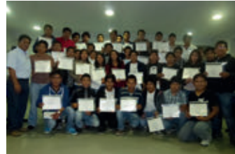
▲ SENATI, Arequipa