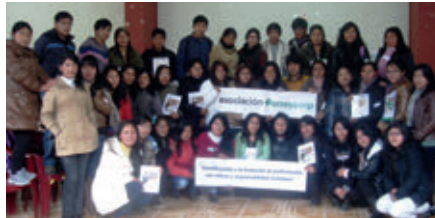
▲ U. N. de Huancavelica, sede Huancavelica