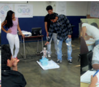
Senati, sede Lima