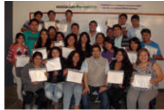
▲ U. N. San Luis Gonzaga