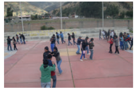
Universidad Nacional de Huancavelica, sede Pampas