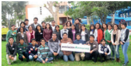
▲ U. N. Mayor de San Marcos