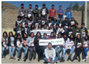
▲ U. N. de Huancavelica - Pampas