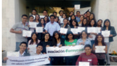
▲ U. Católica San Pablo