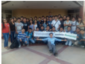
▲ TECSUP Lima