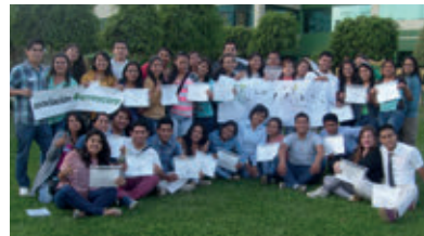
▲ U. Señor de Sipán