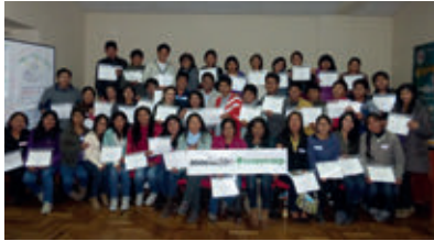
▲ U. N. Santiago Abad del Cusco