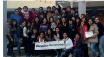
▲ U. P. de Tacna