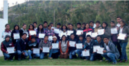
▲ U. N. José María Arguedas