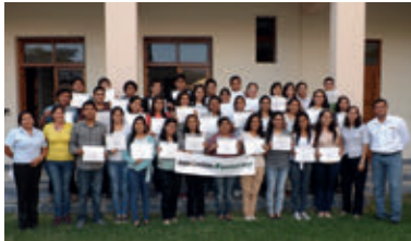
▲ U. de Piura