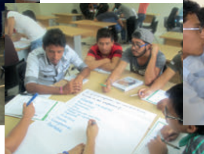
Tecsup, sede Trujillo