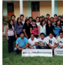
▲ U. N. de Piura