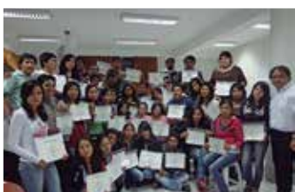
U.N. Micaela Bastidas de Apurímac