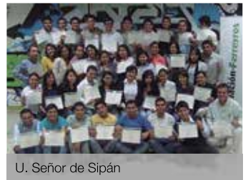
U. Señor de Sipán