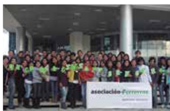
U.N. del Centro del Perú