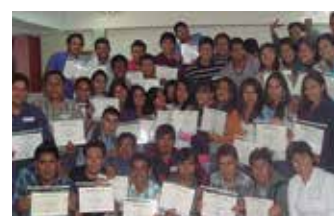
U.N. Pedro Ruiz Gallo