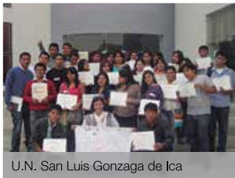
U.N. San Luis Gonzaga de Ica