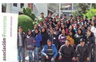
U.N. de Huancavelica