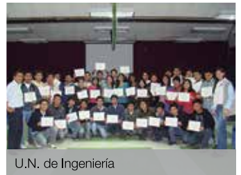
U.N. de Ingeniería