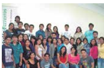
U.N. Hermilio Valdizán