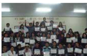
U.N. Jorge Basadre Grohmann