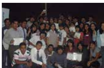
U. José Carlos Mariátegui