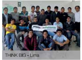
THINK BIG - Lima