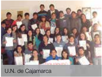
U.N. de Cajamarca