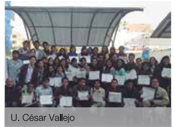
U. César Vallejo