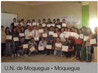
U.N. de Moquegua - Moquegua