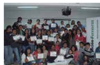
U.P. de Tacna