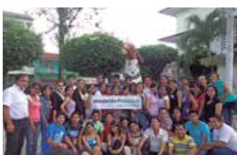
U.N. de la Amazonía Peruana