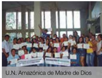
U.N. Amazónica de Madre de Dios