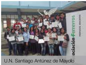
U.N. Santiago Antúnez de Mayolo