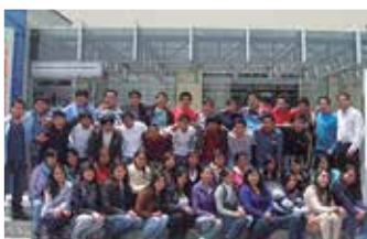
U. Continental de Ciencias e Ingeniería