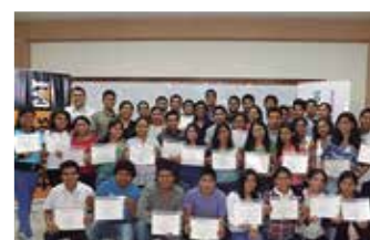
U.N. de Piura