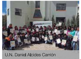
U.N. Daniel Alcides Carrión