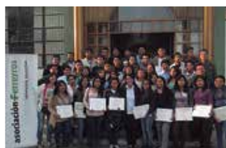
U.N. de Trujillo