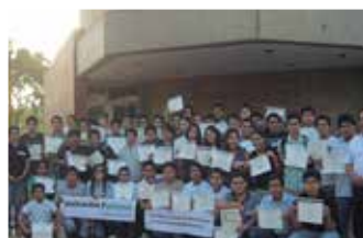
TECSUP - Lima