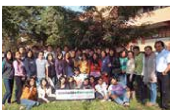
U.N. Mayor de San Marcos