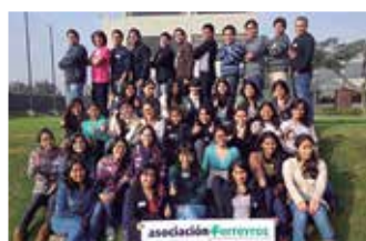
U. San Martín de Porres