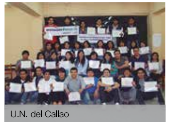
U.N. del Callao