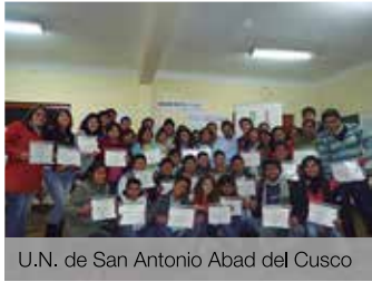
U.N. de San Antonio Abad del Cusco