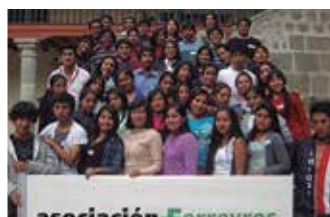
U.N. San Cristóbal de Huamanga