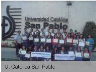
U. Católica San Pablo