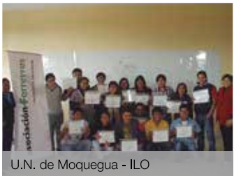
U.N. de Moquegua - ILO