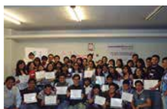
U.N. de San Agustín