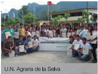
U.N. Agraria de la Selva