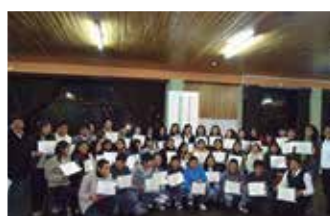
U.N. del Altiplano