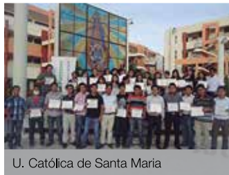
U. Católica de Santa María