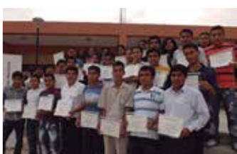
U.N. de Tumbes