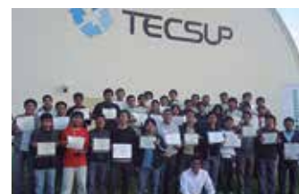
TECSUP - Arequipa