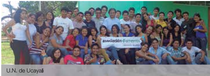
U.N. de Ucayali