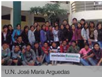
U.N. José María Arguedas