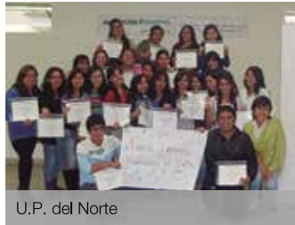
U.P. del Norte