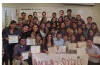
U. Católica Santo Toribio de Mogrovejo