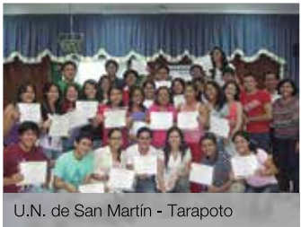
U.N. de San Martín - Tarapoto