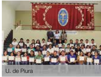
U. de Piura