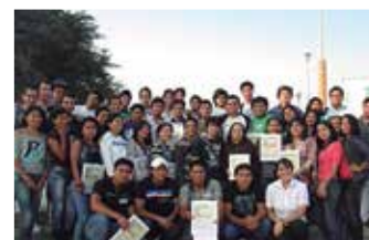
U.N. del Santa